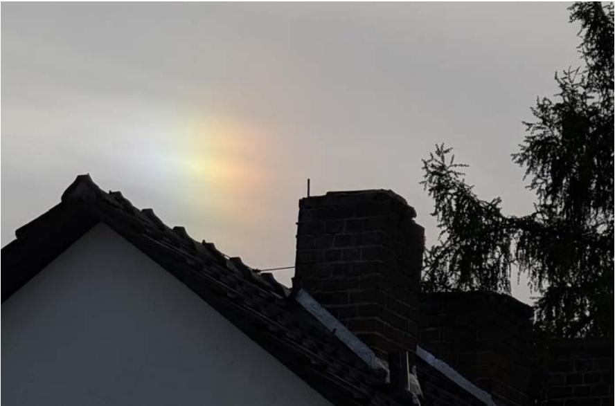
Regenbogenfleck über Zwehren

Die Pflege und Förderung des Heimatgedankens, der Tradition Niederzwehrens und Bewahrung des Andenkens der „Zwehrener Märchenfrau“ Dorothea Viehmann, sowie die Förderung aller Bestrebungen zur Wahrung deutschen Märchengutes, vor allem des Werkes der Brüder Grimm, sind die Hauptziele des Heimatvereins „Dorothea Viehmann“ Kassel-Niederzwehren e. V..