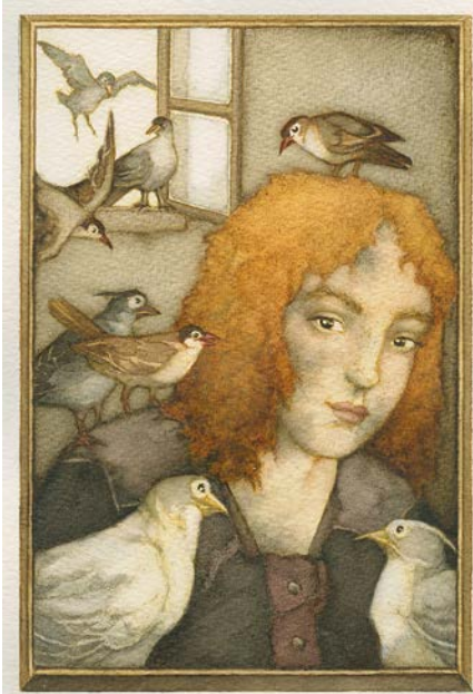
Helga Gebert, Illustration zum Märchen der Brüder Grimm: »Aschenputtel« (unveröffentlicht, o.J.) © Helga Gebert