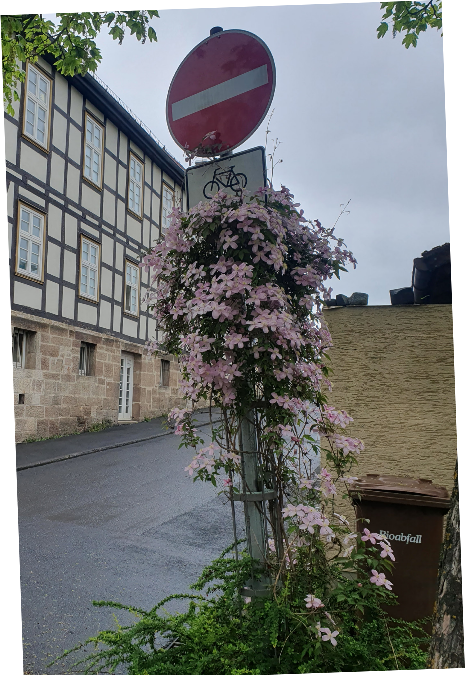
Schmückes Verkehrsschild - Wilfried König