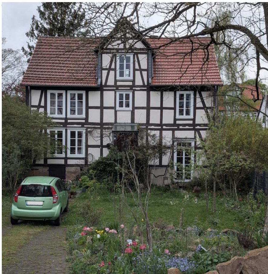
Brüder-Grimm-Straße 27.