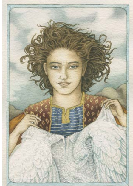
Helga Gebert, Illustration zu »Umschegin und die Schwanenmädchen«, in: Woher und Wohin? Märchen der Frauen , Beltz & Gelberg, 1997 © Helga Gebert

Märchenerzählungen der Fantasie und dem »magischen Denken« überlassen: »Das ist, was man auch als Kind im magischen Alter so sehr liebt - wenn hinter jedem Busch ein Zwerg stehen könnte«.