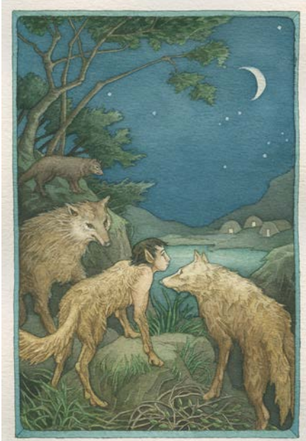
Helga Gebert, Illustration zu »Der Knabe, der ein Wolf wurde«, in: Mutabor. Märchen der Verwandlung , Beltz & Gelberg, 1988 © Helga Gebert