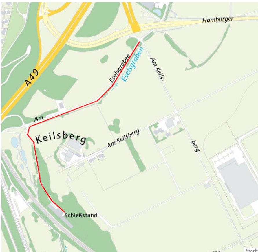
Am Eselsgraben